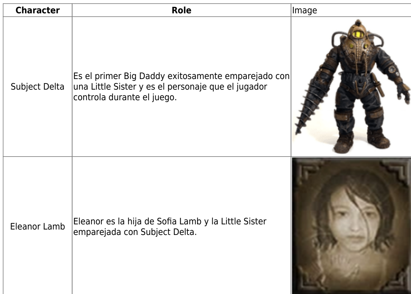
Tabla de Personajes Importantes

Kameo: Elements of Power permite a los jugadores controlar diez guerreros elementales , cada uno con habilidades únicas. Estas formas se obtienen al derrotar espíritus elementales durante la aventura.